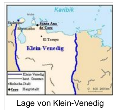
Lage von Klein-Venedig