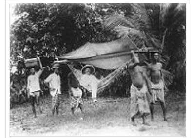
Deutscher Kolonialherr in Togo (ca. 1885)