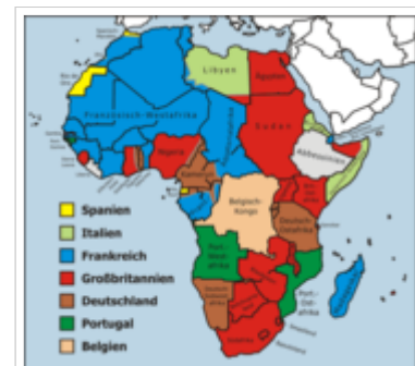
Kolonien in Afrika (1914)