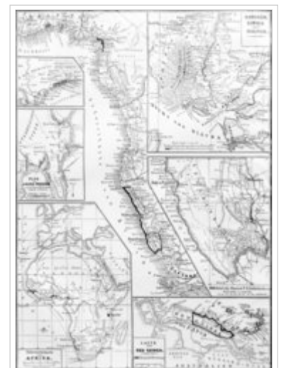
Deutsche Kolonien in Afrika und Papua-Neuguinea um 1885

Bismarcks Politik sah vor, privaten Organisationen durch die staatlichen Schutzbriefe den Handel und die Verwaltung der jeweiligen Deutschen Schutzgebiete zu übertragen. Die staatliche Intervention sollte auf ein finanzielles und organisatorisches Mindestmaß reduziert werden. Diese Strategie scheiterte allerdings innerhalb weniger Jahre: Aufgrund der schlechten finanziellen Situation in fast allen „Schutzgebieten“ sowie der teilweise prekären Sicherheitslage waren Bismarck und seine Nachfolger gezwungen, alle Kolonien direkt und formell der staatlichen Verwaltung des Deutschen Reiches zu unterstellen.