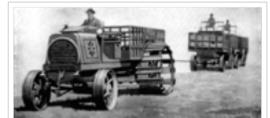
Lastenzug, der in deutschen Kolonien zum Einsatz kam: die Triebräder wurden für weichen Sand durch Eisenschuhe verbreitert