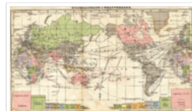
Kolonialbesitz um 1905 (deutscher Besitz in blau)

Unter Kaiser Wilhelm II. versuchte Deutschland durch Gründung weiterer Handelsvertretungen seinen Einfluss als Kolonialmacht auszubauen. Die wilhelminische Ära steht für eine schwärmerisch-expansionistische Politik und eine forcierte Aufrüstung, insbesondere der Kaiserlichen Marine, und strebte einen „Platz an der Sonne“ (der spätere Reichskanzler von Bülow, 1897) für die „zu spät gekommene Nation“ an, womit nicht zuletzt auch der Besitz von Kolonien gemeint war. Diese Politik des nationalen Prestiges befand sich in scharfem Kontrast zu Bismarcks eher pragmatisch begründeten Kolonialpolitik von 1884/1885.